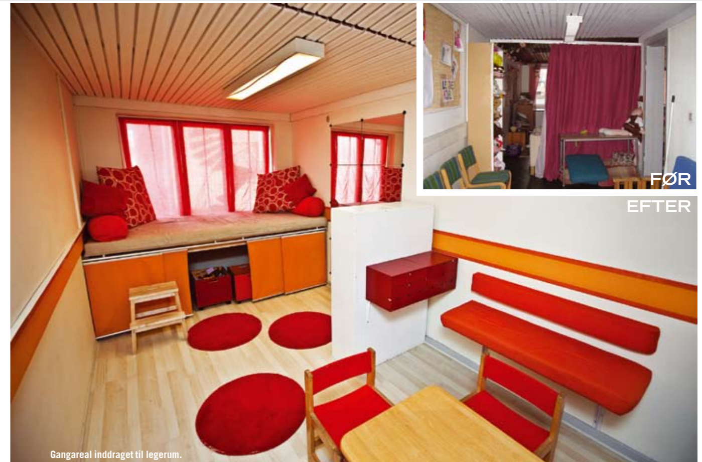
Gangareal inddraget til legerum.

I 3. klasse var væggene tidligere dækket af opslagstavler i forskellige højder og farver mens reolerne var stablet lidt tilfældigt rundt omkring. Nu er tavlerne malet hvide og sat ind i et skinnesystem i to lag med de aktuelle opslag forrest og de mere leksikale plancher og tabeller bagerst. Samtidig er de lave reoler sat på hjul så de kan trilles rundt i klassen når der for eksempel er gruppearbejde. Hver elev har fået sin egen skuffe, malet i indbydende pastelfarver der matcher den Hundertwasser-inspirerede udsmykning ved døren. Og bagerst i klassen hænger en friese med sorte silhuetter af elevernes profiler.